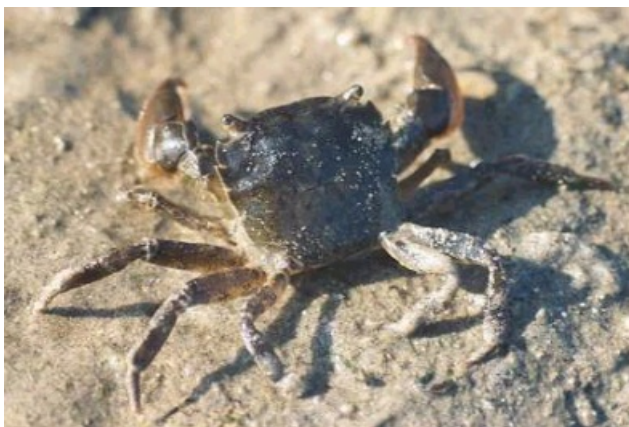
Figuur 1: Penseelkrab, mannetje, rugzijde

De carapax is ongeveer vierkant, met drie anterolaterale tanden (de orbitale tand meegeteld), en een brede, mediaan licht concave voorkant. De mannetjes hebben veel grotere scharen dan de vrouwtjes. Op het scharnier tussen de beweegbare en onbeweegbare vinger van de schaar van het mannetje bevindt zich een sponsachtige dot haar. De looppoten zijn slank en op de zijkant bezet met stevige, korte haren. Aan de bovenzijde is de krab groen-, bruin- of grijsachtig gekleurd, sommige jonge exemplaren hebben grote, witte, symmetrische vlekken. De onderzijde van het lichaam is witachtig. De maximale breedte van het rugschild bedraagt 28 mm.