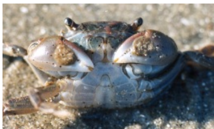
Figuur 2: Penseelkrab, mannetje, buikzijde

Let op het vrijwel vierkante rugschild en de drie tanden aan de zijkant.