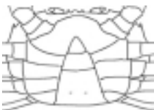
figuur 1: achterlijf mannetje

Bij de meeste soorten krabben zijn de mannetje en vrouwtje eenvoudig te onderscheiden door te kijken naar het achterlijf. Het achterlijf zit bij krabben onder het lichaam gebogen. Bij de mannetjes is dit smal en bestaat het meestal uit drie segmenten (figuur 1), bij de vrouwtjes is het achterlijf breed en bestaat het uit vijf of zes segmenten (figuur 2).