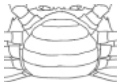
figuur 2: achterlijf vrouwtje

Soms vind je vrouwtjes met eieren. Het achterlijf is dan enigszins omlaag geklapt, en er zitten duizenden oranje tot bruin kleurige eitjes onder.